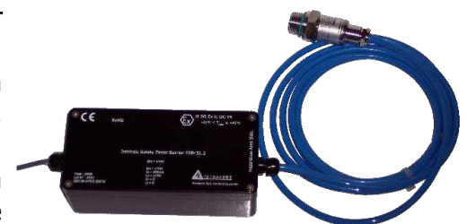
Drucksensor mit einer intrinsischen Sicherheitsbarriere

Der TPL-211 braucht nur einen sehr geringen Energieverbrauch und kann mit der Batterie des TRMC über mehreren Jahre funktionieren.