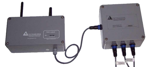
TPL-211 an den TRMC angeschlossen