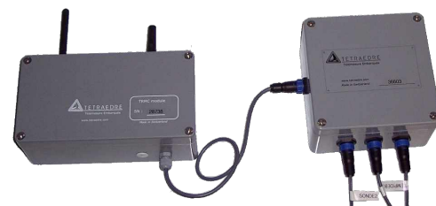
TPL-211 connecté au TRMC