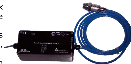
Sonde pression couplée avec une barrière de sécurité intrinsèque

Le TPL-211 n'a besoin que d'une très faible consommation d'énergie et peut fonctionner avec la batterie du TRMC pendant plusieurs années.